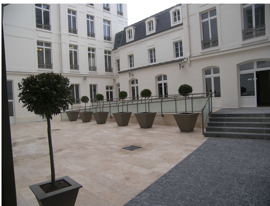
L'îlot formé par l'immeuble comporte une cour intérieure dite « Cour d'honneur »

Convertis en bureaux en 1950 puis occupés par l'Office national interprofessionnel des céréales (ONIC), il a fait l'objet de plusieurs travaux d'extension.