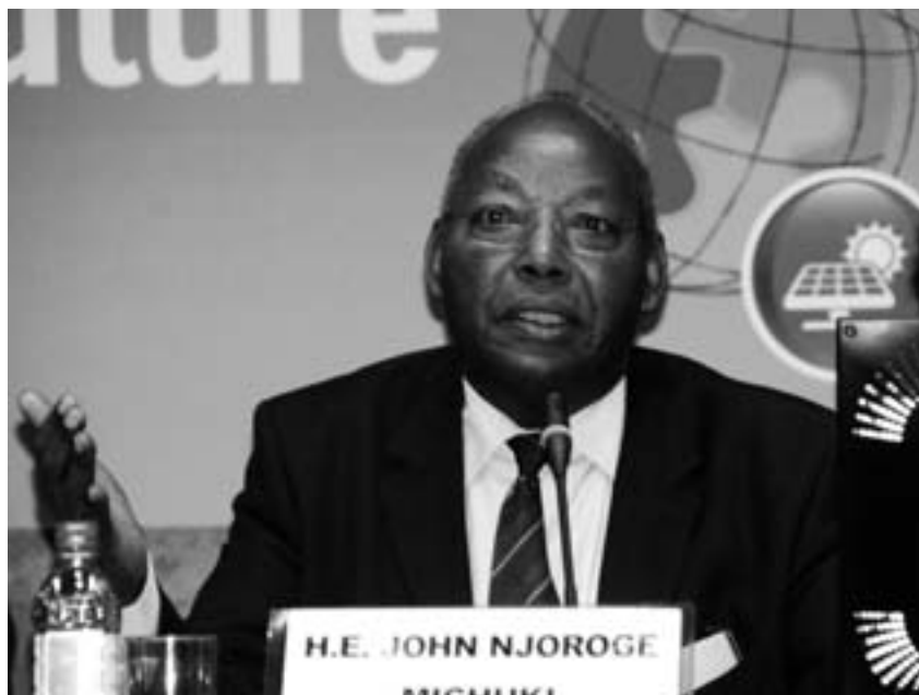
Plusieurs représentants de haut niveau, dont le ministre de l'Environnement et des Mines du Kenya, John Michuki, ont pris part aux consultations du CA-26/FMME.

Bien qu'aucun projet de décision sur l'économie verte n'ait été négocié, les échanges sur ce thème ont occupé une place prépondérante dans les consultations et tables rondes ministérielles. Malgré le lancement du rapport Vers une économie verte : pour un développement durable et une éradication de la pauvreté ( www.unep.org/greeneconomy/ ) qui visait explicitement à contrer certains « mythes et idées reçues »