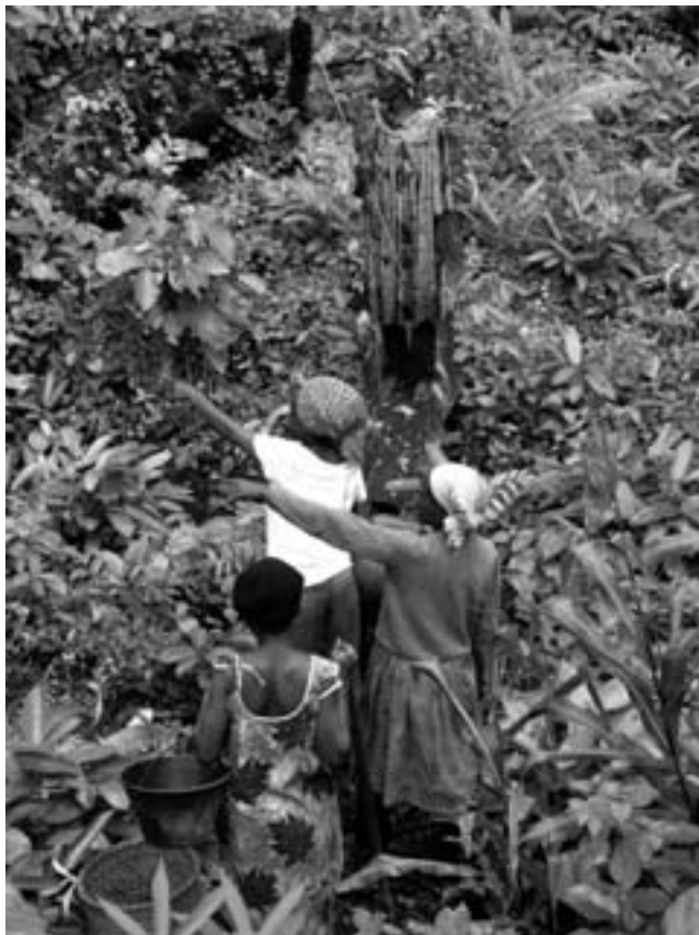
Femmes pratiquant la cueillette dans la forêt modèle de Campo Ma'an (Cameroun).

Il y a deux grandes approches de résolution alternative des conflits : l'approche fondée sur les droits ( right-based ) et celle fondée sur les intérêts ( interest-based ). Les forêts modèles sont basées sur les intérêts, elles sont basées sur des processus narratifs de négociation, de médiation et de compromis qui permettent de repositionner le conflit foncier de telle manière que, à travers les intérêts, on peut avancer vers la résolution d'un certain nombre de problèmes. Dans une question comme la REDD, s'il y a une plate-forme comme celle-là où la question est posée avec une démarche de recherche-action, d'autocorrection et d'apprentissage,