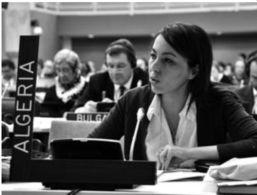
L'Algérie, au nom du Groupe africain, a salué l'adoption de la résolution omnibus.

Rappel : À défaut d'adopter une convention sur les forêts, les pays réunis au Sommet de Rio (Brésil, 1992) ont adopté une Déclaration de principes sur les forêts et engagé une série de dialogues qui s'appuient désormais sur le Forum des Nations unies sur les forêts (FNUF), créé en 2000, de même que sur le Partenariat de collaboration sur les forêts (PCF), établie pour appuyer les travaux du FNUF. En 2007, le FNUF-7 a adopté l'Instrument juridiquement non contraignant concernant tous les types de forêts (IJNC). Toutefois, la question du financement de la gestion durable des forêts est demeurée en suspens. En octobre 2009, une séance spéciale de la FNUF-9 a permis d'adopter une résolution sur les moyens de mise en œuvre ( Objectif Terre , vol. 12, n° 1, p. 25) qui instaure deux nouveaux instruments : un groupe intergouvernemental d'experts à composition non limitée sur le financement des forêts (AHEG, pour Intergovernmental Ad Hoc Expert Group on Forest Financing) et un processus de facilitation dont le mandat consiste à aider les pays à mobiliser des fonds existants.