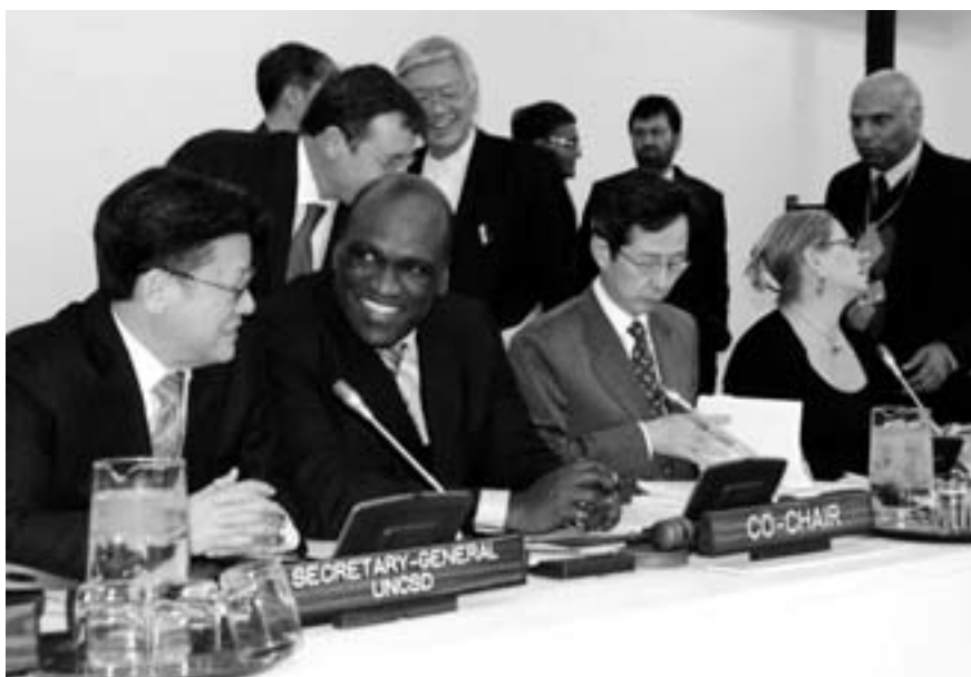
Discussion cordiale entre le secrétaire général de la CNUCC, Sha Zukang (à gauche) et son co-président, John Ashe.