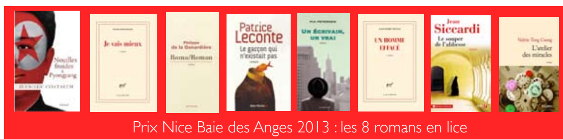
Prix Nice Baie des Anges 2013 : les 8 romans en lice

Pour F-O Giesbert : « C'est un prix qui existe et qui excite les convoitises, il bénéficie d'un très beau palmarès et a fini par s'imposer, tout comme le festival littéraire qui le porte. »