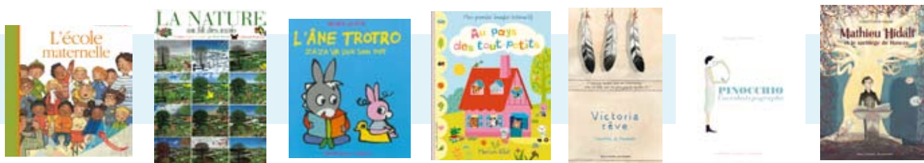
Ouvrages des auteurs Gallimard Jeunesse présents au Festival